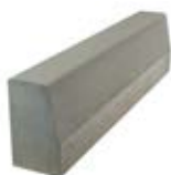
Kiemelt szegélykő 100x15x25 cm