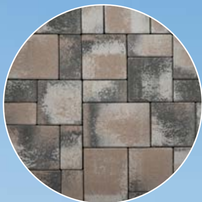
Urban First holdfény