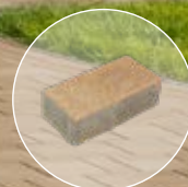
Urban First - mandulasárga